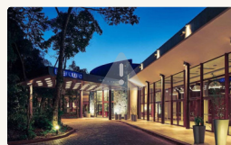
Hotel Mercure Iguazú - Habitación Standard