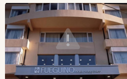
Hotel Fuegoينو - Habitación Standard