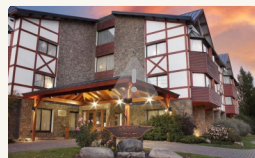
Hotel Calafate Parque - Habitación Standard