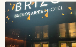
Hotel Grand Brizo - Habitación Standard