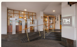
Hotel NH Edelweiss - Habitación Superior