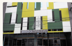
Hotel Brizo Salta - Habitación Superior