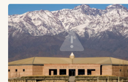
Posada Salentein - Habitación Standard