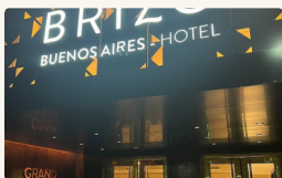
Hotel Grand Brizo - Habitación Standard